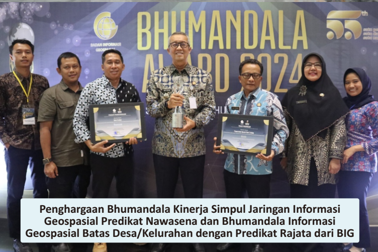
Penghargaan Bhumandala Kinerja Simpul Jaringan Informasi Geospasial Predikat Nawasena dan Bhumandala Informasi Geospasial Batas Desa/Kelurahan dengan Predikat Rajata dari BIG