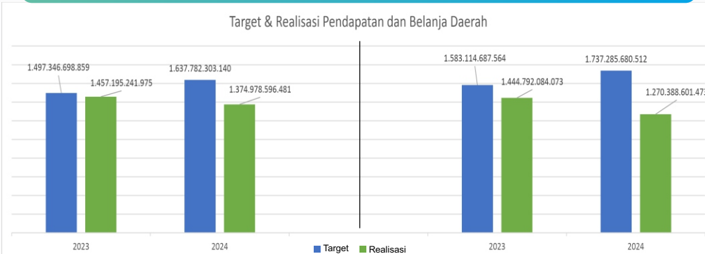
Target & realisasi pendapatan dan belanja daerah tahun 2023-2024