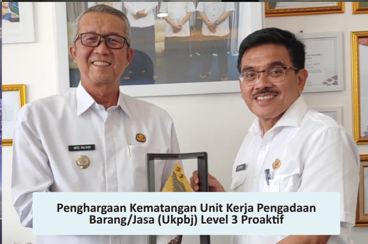
Penghargaan Kematangan Unit Kerja Pengadaan Barang/Jasa (Ukpbj) Level 3 Proaktif