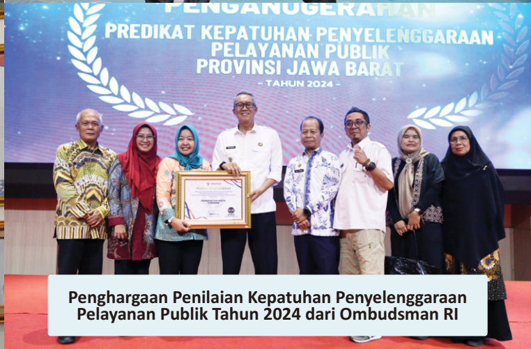
Penghargaan Penilaian Kepatuhan Penyelenggaraan Pelayanan Publik Tahun 2024 dari Ombudsman RI